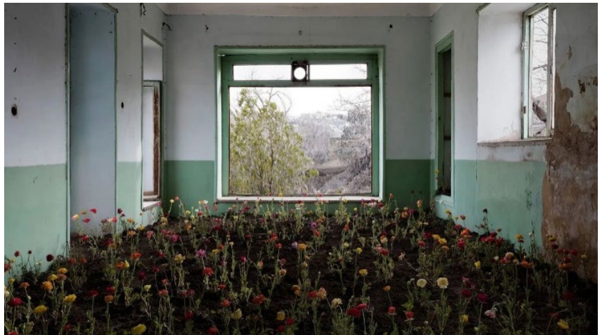
« Home » - Gohar Dashti